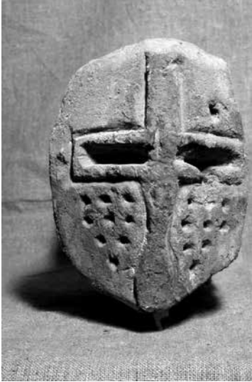
Jn 2. Kiiver peadefriisilt. Fig. 2. Helmet from the frieze of heads.