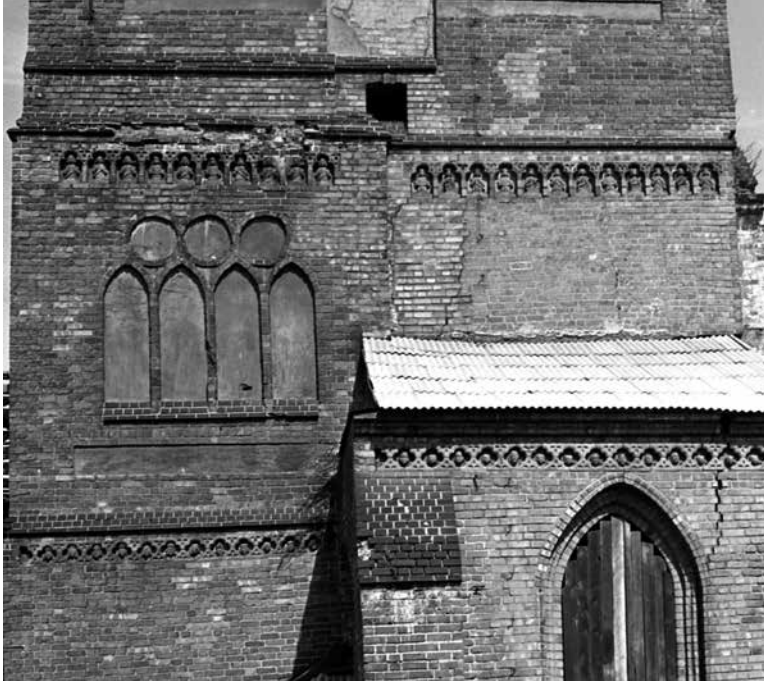
Jn 4. Tornilõunaküljel skulptureeritud friisidega. Fig. 4. Southern side of the tower with sculpted friezes.

teemast enamasti mööda mindud. Enamikus üld- ja ka erikäsitlustes (nt Gustavson 1969) seda üldse ei mainitagi. Probleemi on puudutanud Küllike Kaplinski, kes Tallinna 14. sajandi käsitööd analüüsis osutab ka Mustale Surmale. Toona kasutada olnud kirjanduse väiteil jäi aga Ida-Baltikum katku epitsentrist kõrvale. Seetõttu oletas uurija, et taudi mõju Tallinnale oli üksnes kaudne, tuues kaasa kaubandustegevuse ajutise soikumise (Kaplinski 1980: 8). Seevastu Priit Raudkivi on jõudnud järeldusele, et Must Surm puudutas kahtlemata ka Liivimaa ning oli siinset ajalugu kujundavaks faktoriks juba 14. sajandi teisel poolel (Raudkivi 2010: 17–20). Uues „Eesti ajaloo“ teises köites on seoses katkuga üksnes viide Riiale ning märge: „Kas Eesti ala linnade puhul saab rääkida samas suurusjärgus kahanemisest, pole