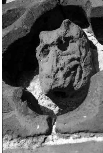
Jn 3. Kuradi pea peadefriisilt. Fig. 3. Head of the Devil from the frieze of heads.

kolmandikku (Alttoa 2011: 50–51). Jälgides sellele ajale eelnenud kümnendeid, keskendub tähelepanu ennekõike sündmusele, mis ilmselt kõige rohkem vapustas ja muutis tervet keskaegset Öhtumaad. See on Must Surm – katkuepidemia, mis alates 1348. aastast (Vahemere piirkonnas oli ta regiooniti päral juba 1347) laastas suurt osa Euroopast.