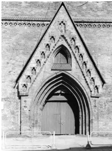
Jn 6. Peaportaal Deesis -grupiga.

jälgimist naabrite juures toimunu. Must Surm jõudis Läänemere maadele hiljemalt 1349. aastal (Taani vahest juba 1348), epideemiliseks muutus see 1350 (Benedictow 2006: 201). Siis on katk tõsiseks teemaks nii Põhja-Saksamaa hansalinnades (Lübeck, Bremen, Hamburg, Stralsund) kui ka Preisimaal (Elbląg/Elbing, Torun, Königsberg, Malbork/Marienburg). Oliva tsistertslaste kloostri kroonika teateil levis katk kõikjal Preisias ja Pommeris. Toonase taudi kirdepoolse punktina on allikates fikseeritud Klaipeda/Memel. 1350. aasta lihavõttepühade ajal puhkes katku epideemia ka Visbys (Bergdolt 2000: 83–85; Benedictow 2006: 196–199). Peab toonitama, et tegu pole ajalookirjutajate fikseeritud üksikjuhtude, vaid katastroofilise epideemiaga. Mõistetavalt on andmed vägagi lünklikud, kuid teinekord on need äärmiselt kõnekad. Nii pärineb Wismarist teade, et 1350. aastal oli siin ühe kuu jooksul üle 2000 surmajahu. Bremenis oli 1351. aastal katku tagajärjel umbes 7000 surnut. Lübeckisse jõudis Must Surm 1350. aasta nelipühade paiku ning arvestuste kohaselt viis see teispoolsusse 28% majaanikest ja tervelt 35% raehärradest (Bergdolt 2000: 82–83).