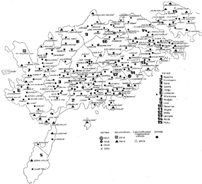
Joonis 1. 215 majandinime, mis olid kasutusel Saaremaal aastail 1947–1950 (Kasepalu 1985: 24).