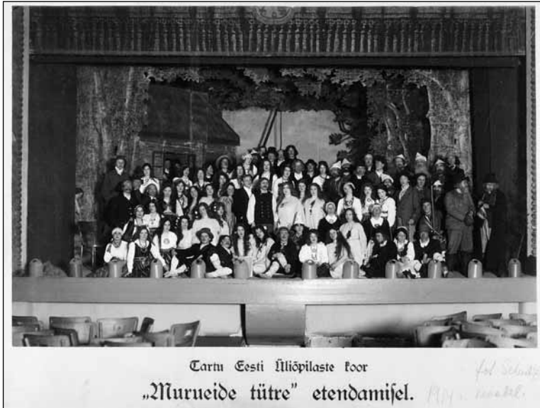
Foto 7. Tartu Eesti Üliõpilaste koor „Murueide tütre“ etendusel kevadel 1914. ERM Fk 292:2

Photo 7. Tartu Estonian Students Choir at the performance Murueide tütar (The Daughter of the Mother of the Sward) by composer Miina Härma in the spring of 1914.