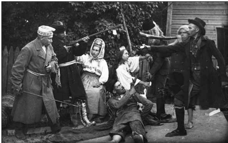
Foto 3. Kadrina vanavarakorjajad 6. juulil 1914 vanavaranaäituse puhul fotograafide esinemas. ERM Fk 513:14.

Photo 3. Heritage collectors from Kadrina parish presenting themselves photographed at the Heritage exhibition on July 6, 1914.