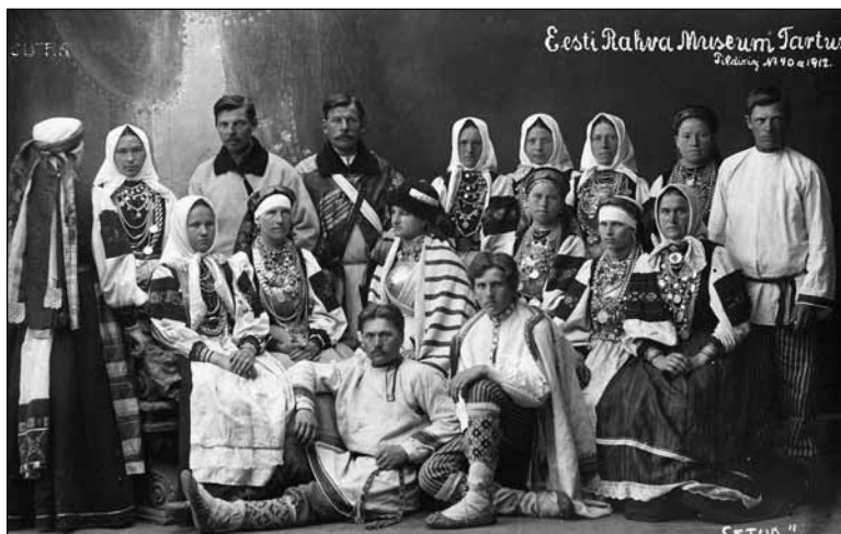
Foto 6. Setud. Vanemuises 1912. aastal toimunud setu õhtu. ERM Fk 235: 29.

Photo 5. Godfather is asked to a wedding. Setu evening at Vanemuine theatre in 1912.