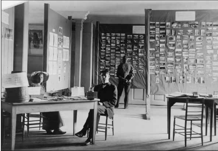
Foto 9. Kodumaa piltide näitus Tartus. ERM Fk 213:319. Foto: Johannes Pääsuke 1913.

Photo 9. Exhibition of pictures of the homeland.