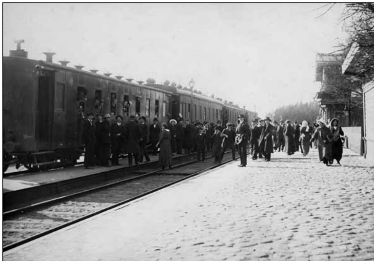
Foto 8. Tartu Eesti Üliõpilaste koori reis Tallinna „Murueide tütre“ etendusele. ERM Fk 292:3. Foto: Johannes Pääsuke 1914.

Photo 8. Tartu Estonian Students Choir going to Tallinn for the performance of Murueide tütar (The Daughter of the Mother of the Sward).