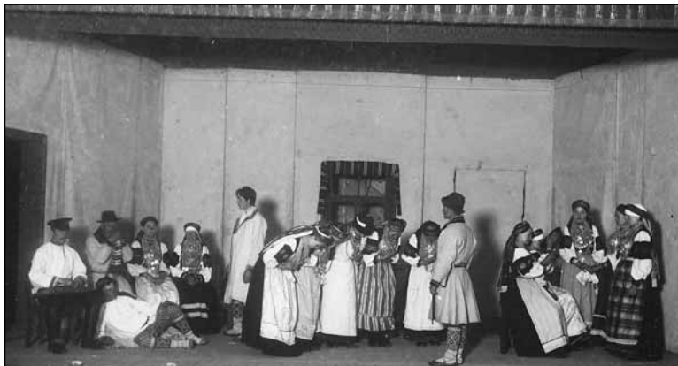
Foto 5. Ristiisa kutsutakse pulma. Vanemuises 1912. aastal toimunud setu õhtu. ERM Fk 235:18.

Photo 5. Godfather is asked to a wedding. Setu evening at Vanemuine theatre in 1912.