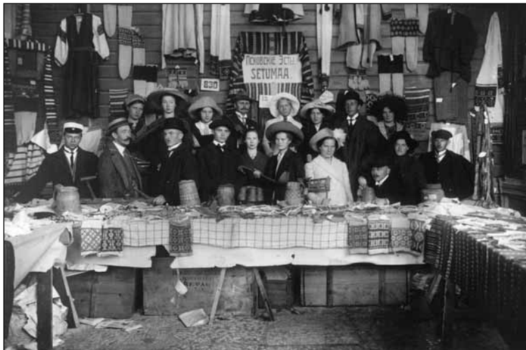
Foto 11. Muuseumi lille müüjad Tallinna näitusel 1912. ERM Fk 365:48.

Photo 11. Flower sellers from the museum at an exhibition in Tallinn in 1912.