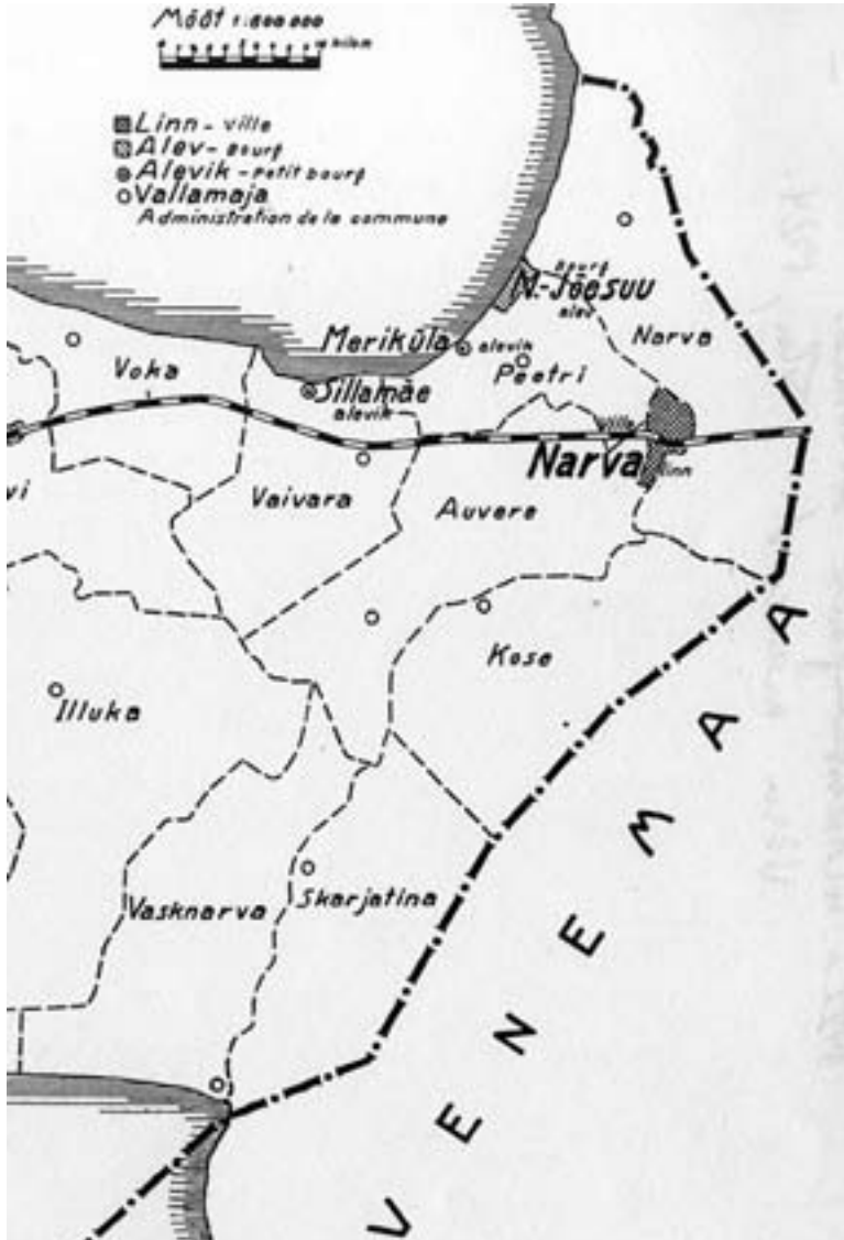
Joonis 1. Virumaa Narva-tagused vallad (väljavõtte skeemist: 1922. a. üldrahvalugemise andmed. Vihk IV. Viru maakond. Tallinn, 1924).